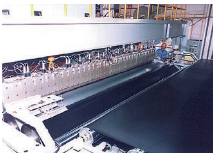
5.15メートルの広幅シート